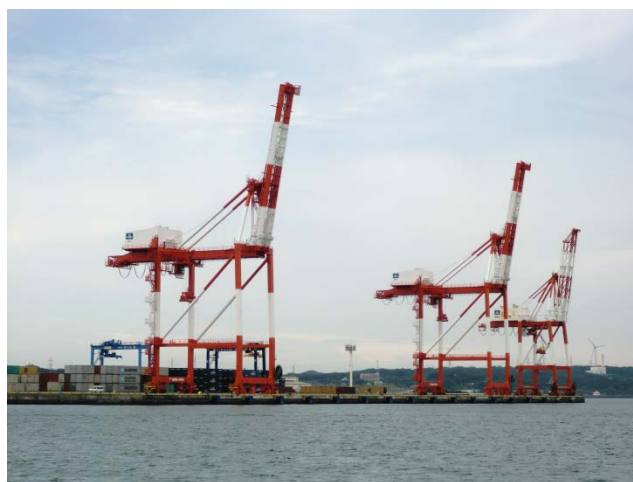
船上から見えるコンテナターミナル