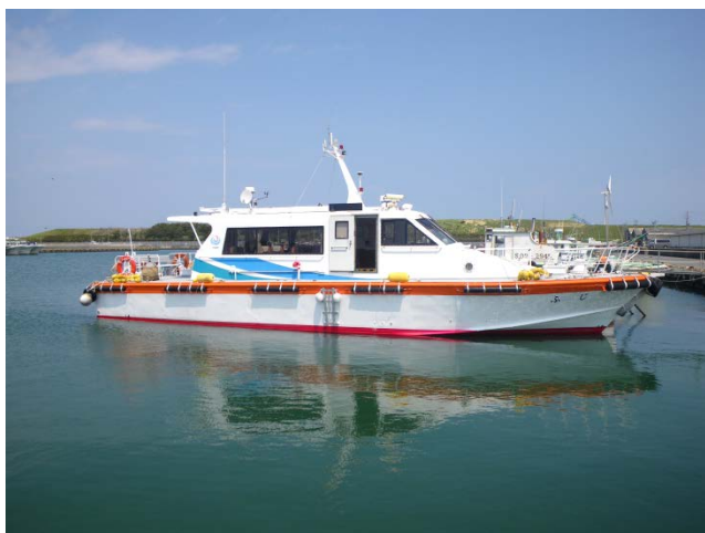
見学で乗船する港湾業務艇「ふじ」

この御前崎港について、普段は見るのが難しいコンテナターミナルなどの港の施設、整備中の防波堤などの工事現場や作業船を船上から見学することを通じて、保護者の方に港の役割や地震・津波への心構えなどについてご理解いただき、園児にも港の見学の体験で港に対する興味が深まることを期待しています。