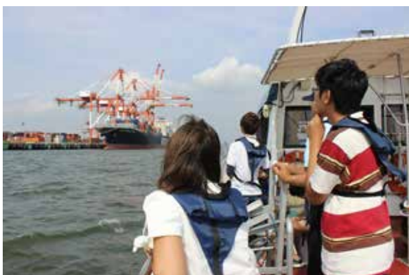
港内見学の様子 (たかちほ)