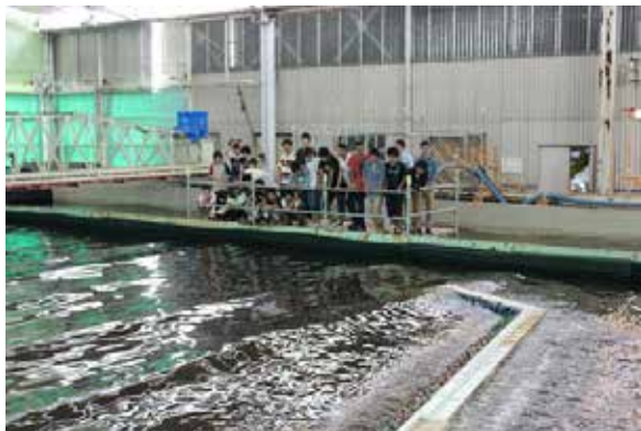
波浪平面水槽の見学の様子