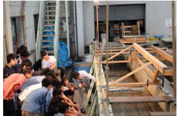
長水路水槽の見学の様子