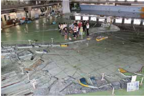
伊勢湾環境水槽の見学の様子