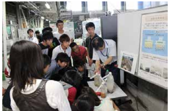
簡易液化化実験(エッキー)の様子