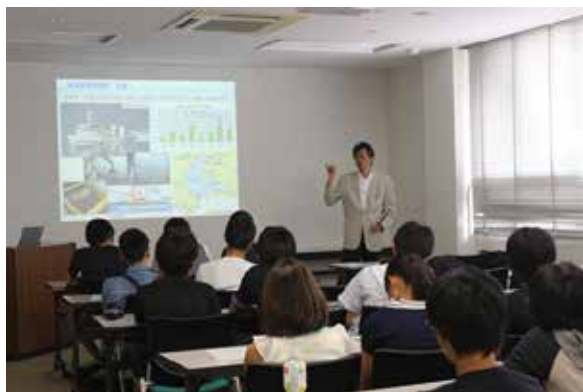
名古屋港湾事務所での座学の様子