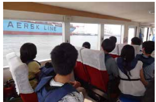
港内見学の様子 (翔龍)